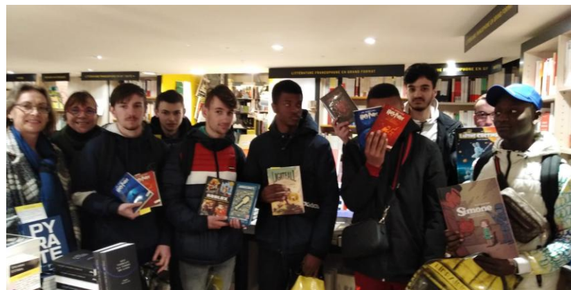
Les élèves de T CAP MBC avec les livres qu'ils ont choisis.

Une découverte enrichissante qui a stimulé les appétits de lecture.